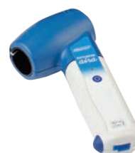
DATOSPIR aira TURBINA