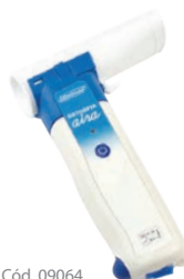
DATOSPIR aira DESECHABLE