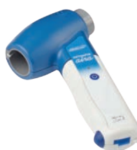
DATOSPIR aira FLEISCH