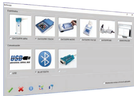
Compatible con todos los espirómetros Sibelmed